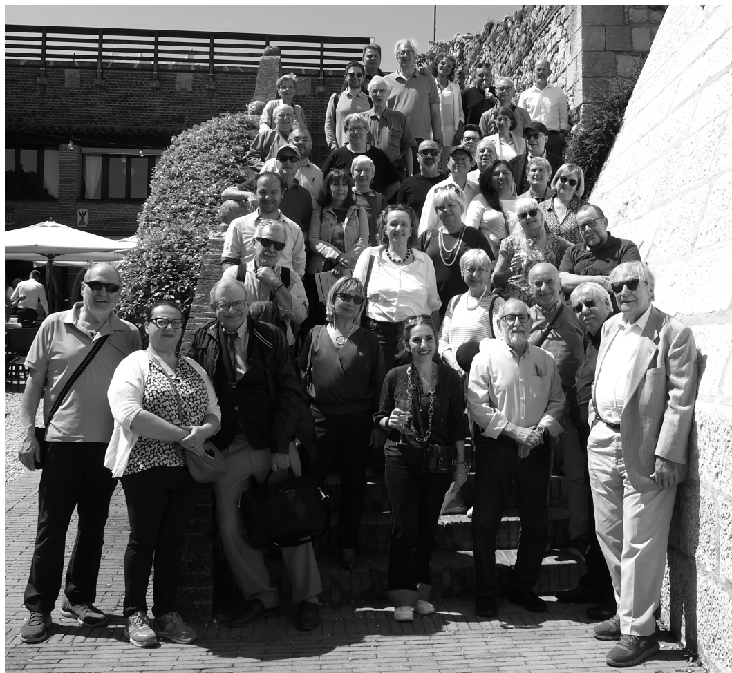
il gruppo dei partecipanti